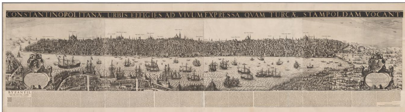
Рис. 1. Вид города Константинополя, называемого турками Истамбул

оба были захвачены мусульманами. Так, к захвату турецкой столицы призывали Станислав Ореховский [9; 10], Мартин Пашковский [5], Мартин Стрыйковский [8], Петр Грабовский [2], Николай Хабельский [1] и многие другие.