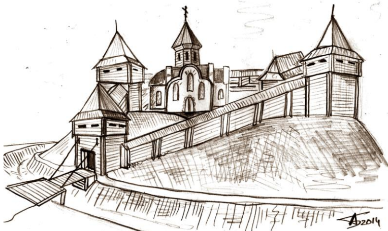
Рис. 5. Вариант реконструкции замка в Остре середины XVI в.

То есть, как видим, сама замковая гора не была серьёзным препятствием во время приступа, и в самой люстрации дается рекомендация, с наиболее уязвимых мест выкопать новый ров. Постепенно склон городища подмывался водами р. Остер (этот процесс продолжается и сейчас) и оборонительные сооружения начали сползать в сторону реки.