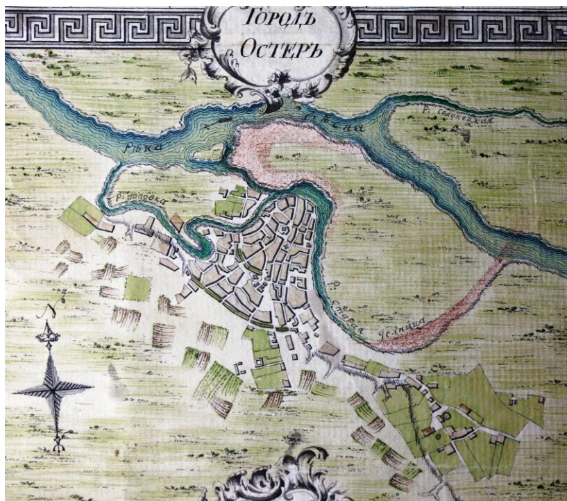
Рис. 3. План Остра 1780-х годов с изображением остатков оборонительных валов.

Что касается изобразительных источников, то кроме, вышеупомянутого изображения Остра М. Грюневега, имеется ряд его изображений на картах XVII-XVIII вв. Но следует учитывать, что эти изображения очень и очень схематичны. Первые инструментальные планы Остра появляются лишь в конце XVIII в., когда Остер стал уездным центром Киевского наместничества (рис. 3). Также, некоторую ценность несут художественные рисунки и фото Остра XIX – начала XX вв., поскольку на них часто можно рассмотреть фортификационные элементы, уничтоженные уже в XX в.