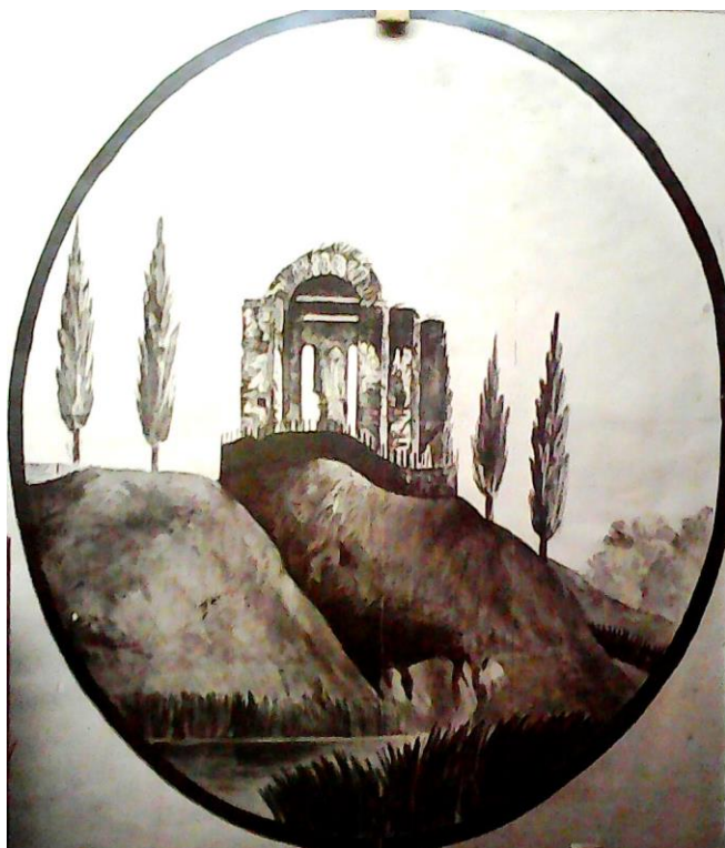
Рис. 4. Юрьева Божница на остатках замковой горы (древнерусского детинца) в Остре. Рисунок конца XIX – начала XX вв.