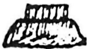
Рис. 2. Рисунок с изображением фрагмента укреплений Остра 1584 г. Мартина Грюневега.

Что касается изобразительных источников, то кроме, вышеупомянутого изображения Остра М. Грюневега, имеется ряд его изображений на картах XVII-XVIII вв. Но следует учитывать, что эти изображения очень и очень схематичны. Первые инструментальные планы Остра появляются лишь в конце XVIII в., когда Остер стал уездным центром Киевского наместничества (рис. 3). Также, некоторую ценность несут художественные рисунки и фото Остра XIX – начала XX вв., поскольку на них часто можно рассмотреть фортификационные элементы, уничтоженные уже в XX в.