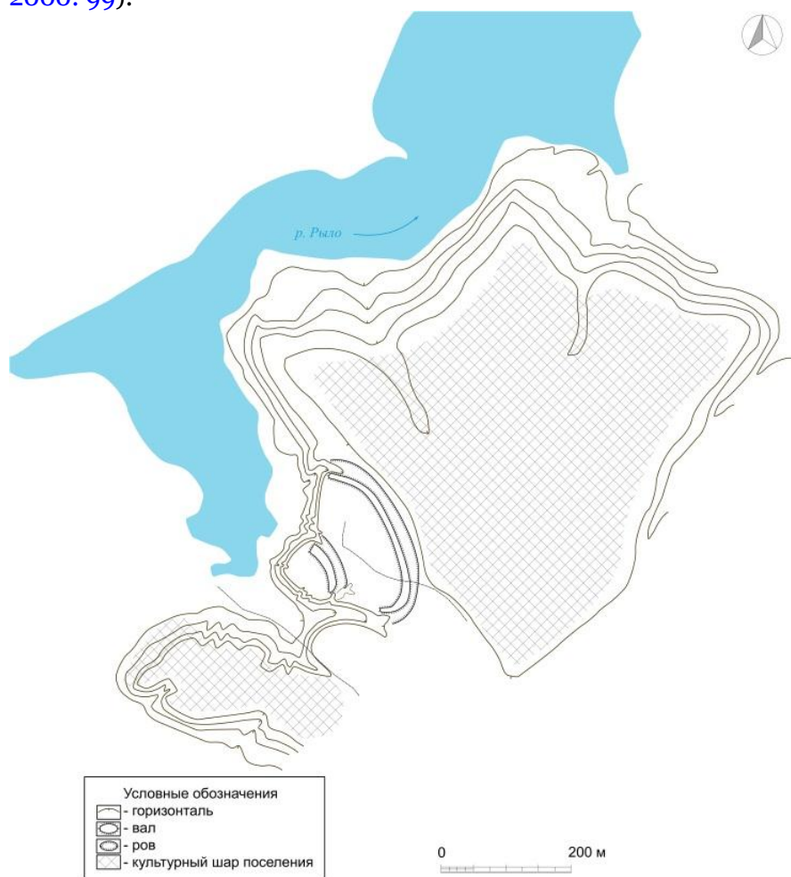
Рис. 3. Археологический комплекс около села Коренское. План автора по результатам разведок П. Гайдукова 1980 г.

Ю. Липкинг так же коротко описывает городище, как мощную крепость и датирует ее древнерусским временем (Липкинг, 1969: 190). В 1980 г. городище обследовал П. Гайдуков. Он собрал небольшую коллекцию гончарной керамики и открыл поселения, расположенные к северу и югу от укреплений (Археологическая карта России, 2000: 99-100). На основе описаний памятника автором составлен общий план комплекса с расположением городища и посадов (Рисунок 3). Размеры детинца составляют 80 x 45 м, а площадь около 0,2 га. Укрепленный посад имеет площадь 1,5 га. Общая площадь открытых поселений 20,5 га (северное) и 2 га (южное). По устройству и площади открытых поселений археологический комплекс имеет сходство с Емадыкинским. А. Кашкин считает археологический комплекс у с. Коренское остатками города древнерусского времени (Археологическая карта России, 2000: 99).