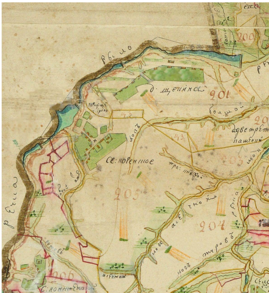
Рис. 1. Фрагмент «Генерального плана Городу Рыльску...» 1785 года на котором обозначены «городище Т...ерское» и лог Туров

В конце XIX века вопросами локализации летописных городов, упоминаемых в связи с событиями 1283–1284 годов занимались В. Лазаревский, А. Бунин и В. Голубовский, но их исследования касались, в основном локализации городов Воргол и Липецк (7, 458; 3, 111–113; 2, 6–7). В дальнейшем в историографии укоренилась версия о расположении летописного Воргола на городище Вишневая Гора на р. Клевень. Исходя из этого предпринимались попытки локализации села Туров. Не имея определенных географических указаний в тексте летописей А. Бунин предположил его нахождение в бассейне небольшой речки Туровки, правой притоки р. Псел, ниже по течению от Обояни. С такой трактовкой согласен А. Зайцев, хотя и с оговоркой о недостаточности археологических данных (Зайцев, 2009: 210–213). Топонимы и гидронимы с корнем «тур» являются достаточно распространёнными в исследуемом регионе, на что обратил внимание ещё В. Приймак. Реки Туровка и Турочка (притока Клевени), а также лес Туре и лог Туров яркое тому подтверждение и не могут являться достаточным основанием для локализации летописного города (Супруненко и др., 2004: 65).