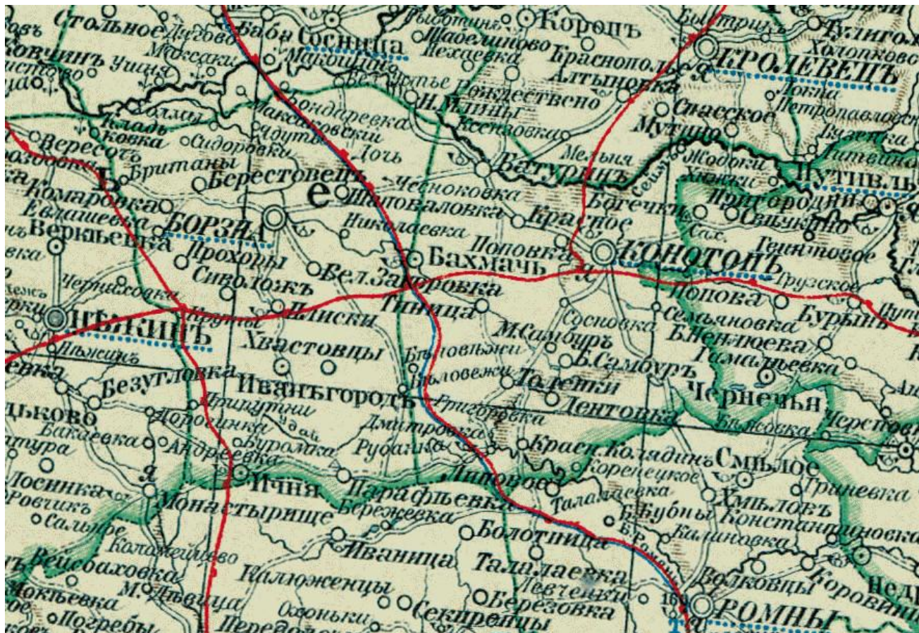
Рис. 4. Фрагмент Большого Всемирного настольного Атласа Маркса. Э.Ю. Петри, Ю.М. Шокальский, 1910 г., Европейская Россия, лист 10-ый (Шокальский, 1910)

Ни в опубликованном в 1903 г. типографией Адольфа Фёдоровича Маркса атласе, в котором данные о европейской части России базируются на картах И.А. Стрельбицкого (опубликованы Военно-топографическим управлением главного штаба), и сравнённые с картами Императорского русского географического общества 1862 г. (Рисунок 4). Этот колоссальный по тем временам картографический труд и, впечатляющий своей достоверностью, не может игнорироваться, и ещё больше отодвигает дату рождения Завод – к середине-концу XIX века.