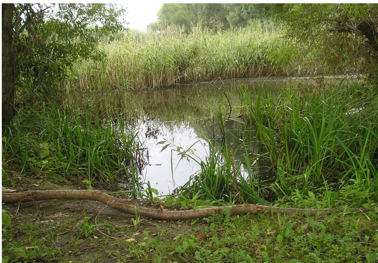
Рис. 7. Исток реки Куколка в виде пруда у огородов в селе Заводы 2010 год.

Заводы стоят на реке Куколке, имеют плодородный чёрнозём и окружены сочными густыми лугами, что и определило их возникновение и производственный смысл существования. Истоком реки был заболоченный луг в виде четырёх «долин» (в простонародье – сенокосы), который в свою очередь, приняв очертания узкого пруда со стоячей водой, ряской и рогозом делит Заводы на «Северобережные» (Заставок) и «Южнобережные» (Хутор). Пруд питает огороды селян живительной влагой и наполняет их колодцы чистой, приятной на вкус, но очень жёсткой водой ( Рисунок 7 ).