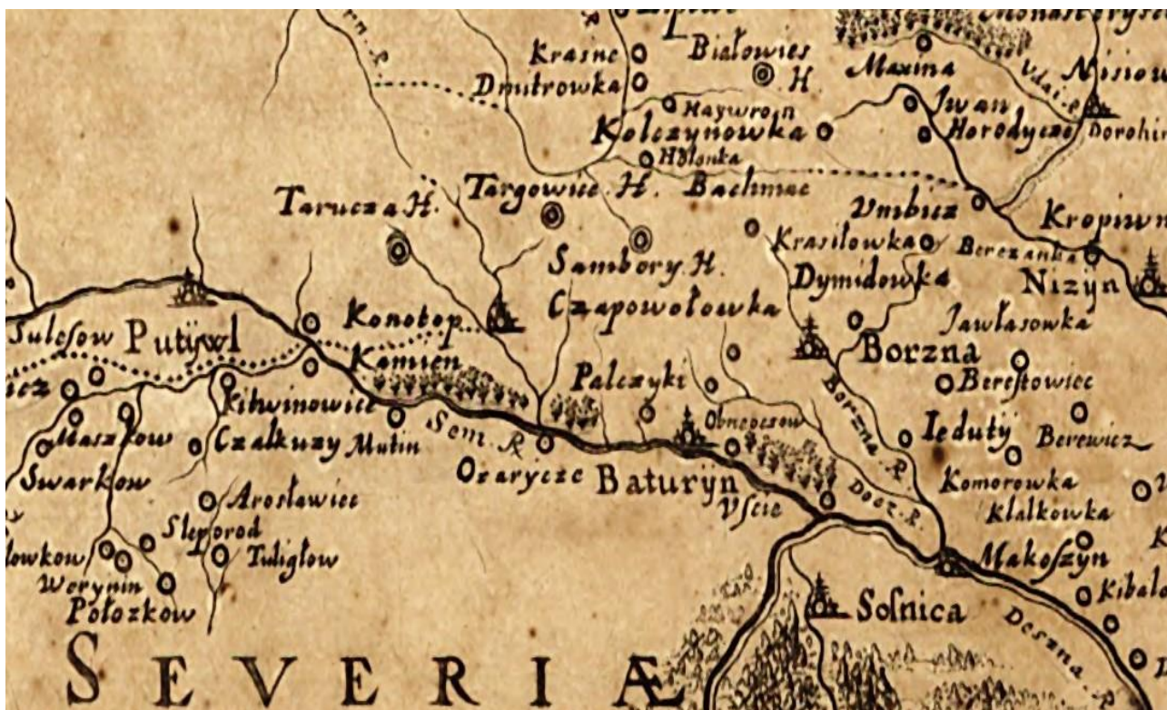
Рис. 6. Фрагмент карты Польши XVII века, 1648 год (de Beauplan, 1660).

В 1687 г. новоизбранный гетман Иван Мазепа в знак благодарности своим покровителям, раздавал полковничьи и генеральские уряды. В итоге в ходе реорганизаций Черниговское полковничество, в состав которого входила и Сосновка, было отдано в наследное владение черниговскому полковнику Якову Лизогубу, который перебрался на Конотопщину и занял свободную территорию около Конотопа и Малого Самбора ещё в 1675 г. в поисках новых пастбищ для скота.