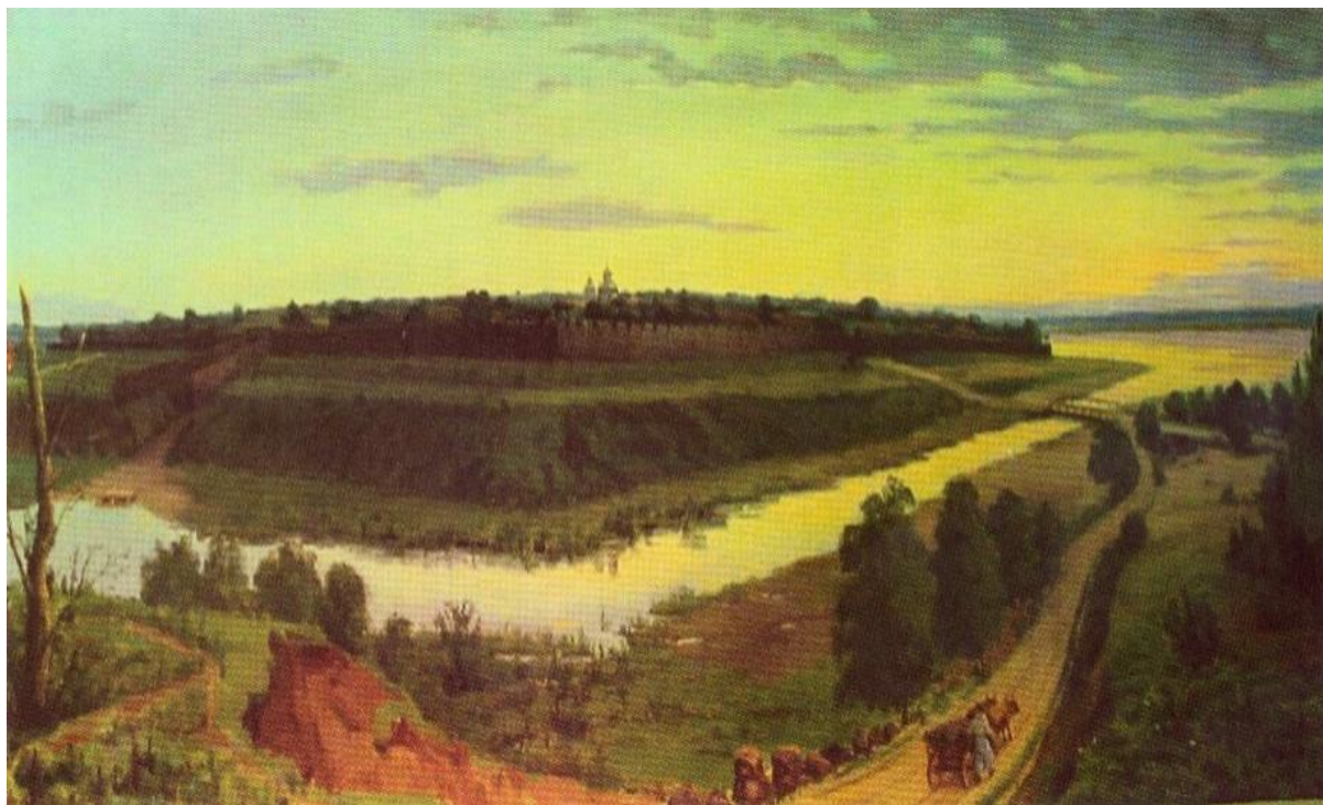
Рис. 2. Конотопское укрепление, XVII век. Художник В.Г. Шерстюк (Экспонат Конотопского городского краеведческого музея им. А.М. Лазаревского)

В те времена город Конотоп был одним из оплотов гетмана Ивана Евстафьевича Выговского (начало XVII века – 1664 г.) на северо-восточном рубеже Украины ( Рисунок 2 ).