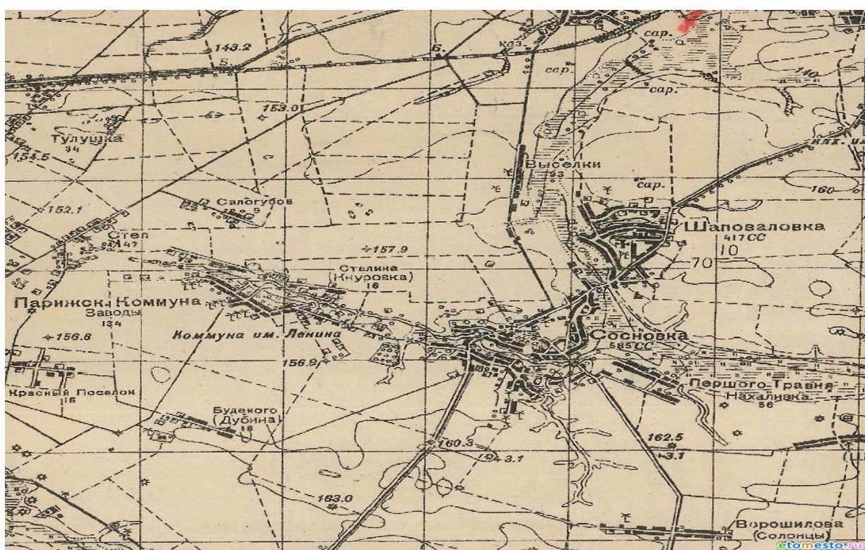
Рис. 8. Село Заводы в начале-середине XX века (Карта..., 1941)

В 1929–1930 гг. ещё неосвоенное технологическим прогрессом село, впервые указано на картах как Заводы (Парижская Коммуна). Границащие с ними коммуны им. В.И. Ленина и Сталина (Кнуровка), затронула всеобщая коллективизация – был образован колхоз им. В.М. Молотова и был мощным предприятием под руководством Ильи Андреевича Кондратенко (Рисунок 8). За хорошие урожаи он был удостоен ордена из рук Михаила Ивановича Калинина – видного советского партийного деятеля, председателя Президиума Верховного Совета СССР.