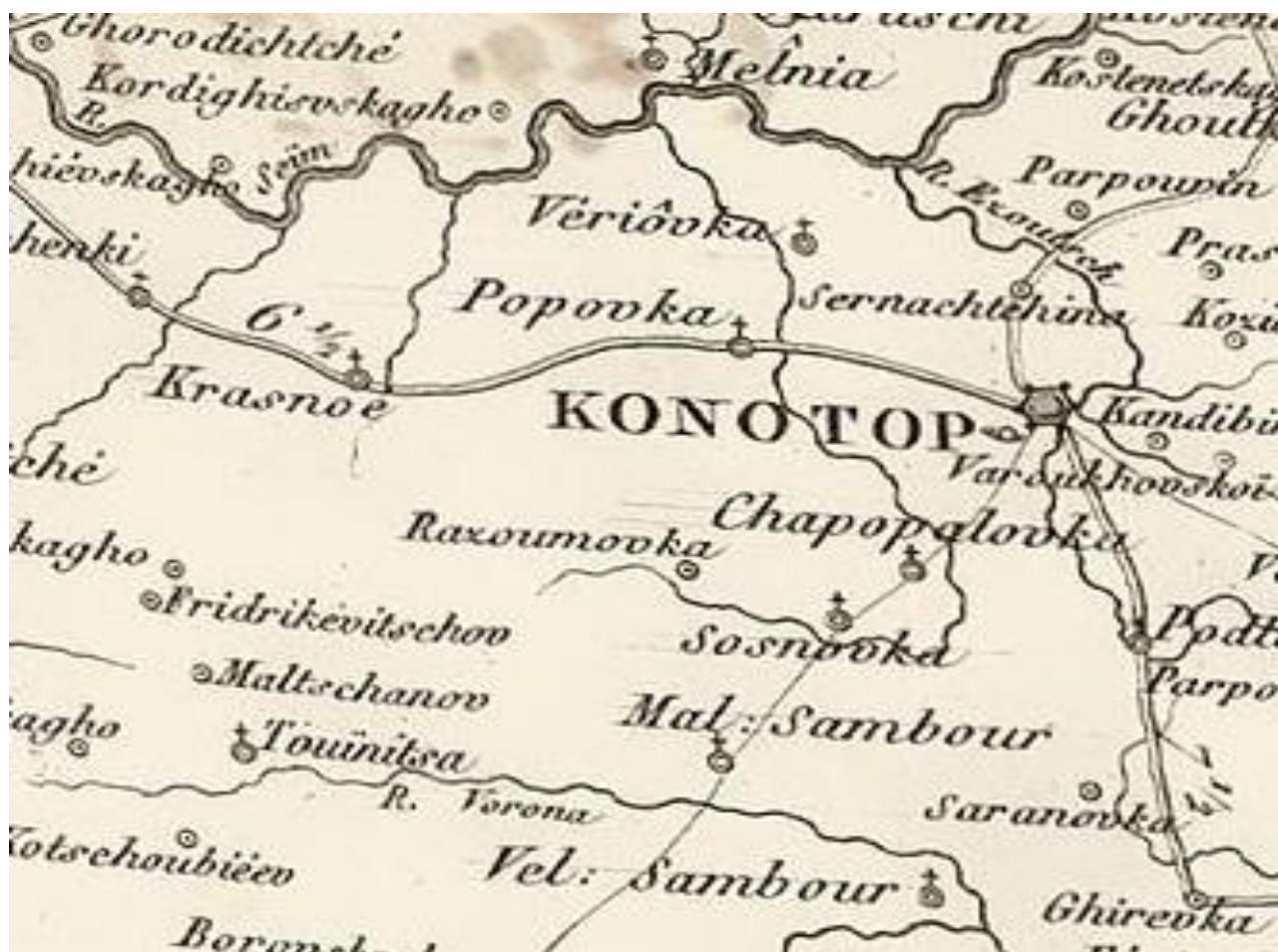
Рис. 5. Первое указание села Великий Самбор на картах. Большая карта Российской Империи для Наполеона, 1812 г. (Большая карта..., 1812)

Однако согласно другим источникам Великий Самбор стал развиваться в начале XVI века, и в период с конца XVI до середины XVII века находился под властью Речи Посполитой (Тронько, 1973), а на картах дебютирует в 1812 г. (Рисунок 5).