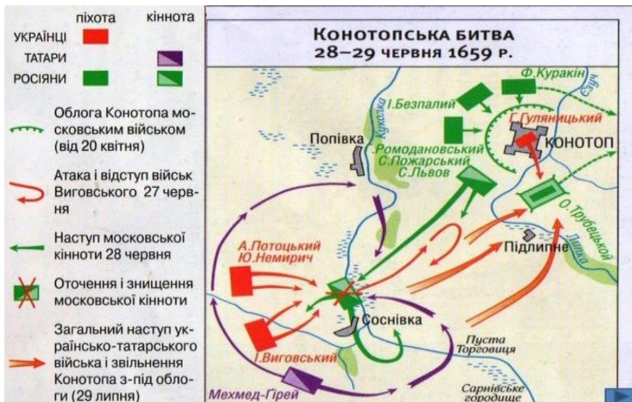
Рис. 3. Схема Конотопской битвы 1659 г. Сергей Горобец, Сергей Бутко. Украинский институт национальной памяти, 9 июля 2020 г.

хутора – Сарановки. В свою очередь, татарский хан, отделившись от Выговского, пошёл по южному берегу Куколки до Пустой Торговицы и, переправившись через неё, затаился засадой, ожидая разгара сражения (Сокирко, 2008). Узнав о передвижениях Выговского, Трубецкой отрядил к Сосновке значительную часть вверенных ему людей под командованием князей Фёдора Юрьевича Ромодановского и Семёна Романовича Пожарского, расположившихся по берегам реки Куколки. В решающей битве 29 июня 1659 г., потеряв кавалерию, которая увязла в мягких болотистых почвах, русская армия была разгромлена (Рисунок 3).