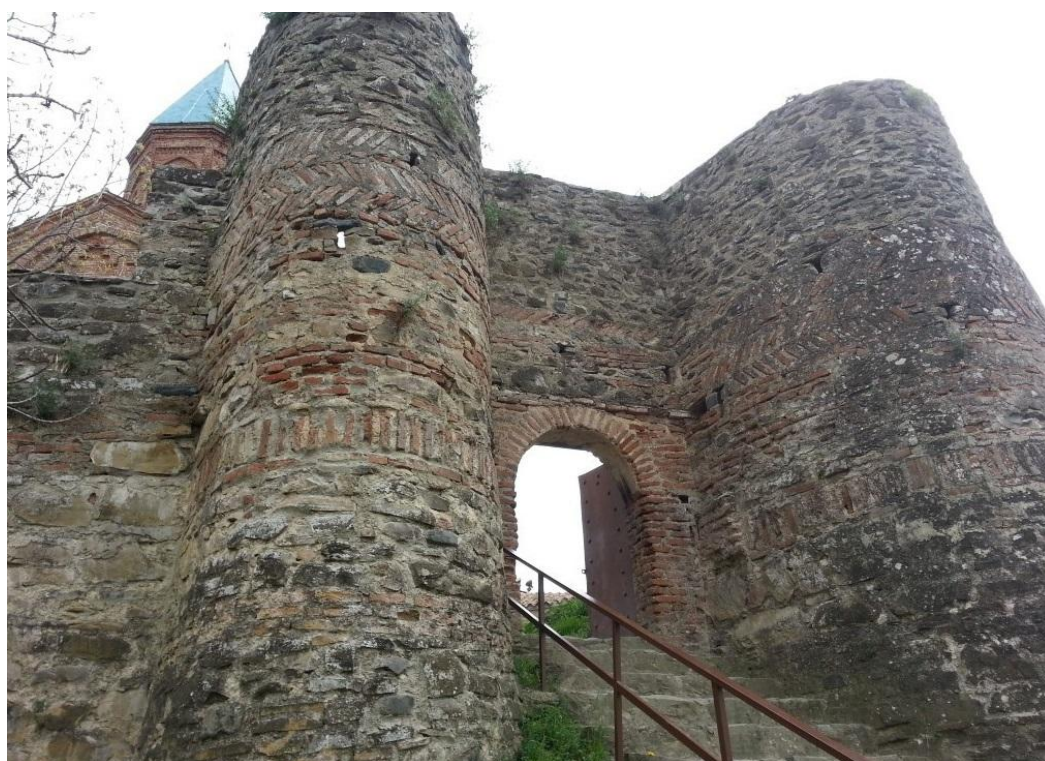
Рис. 2. Крепость Греми. Центральные ворота

Записки русских послов о том, что храм был построен царем Леваном, подтверждается фреской с изображением царя Левана, который держит в руках макет церкви. Рядом с фреской надпись: «Царь Леон строитель». Здесь же гробница царя.