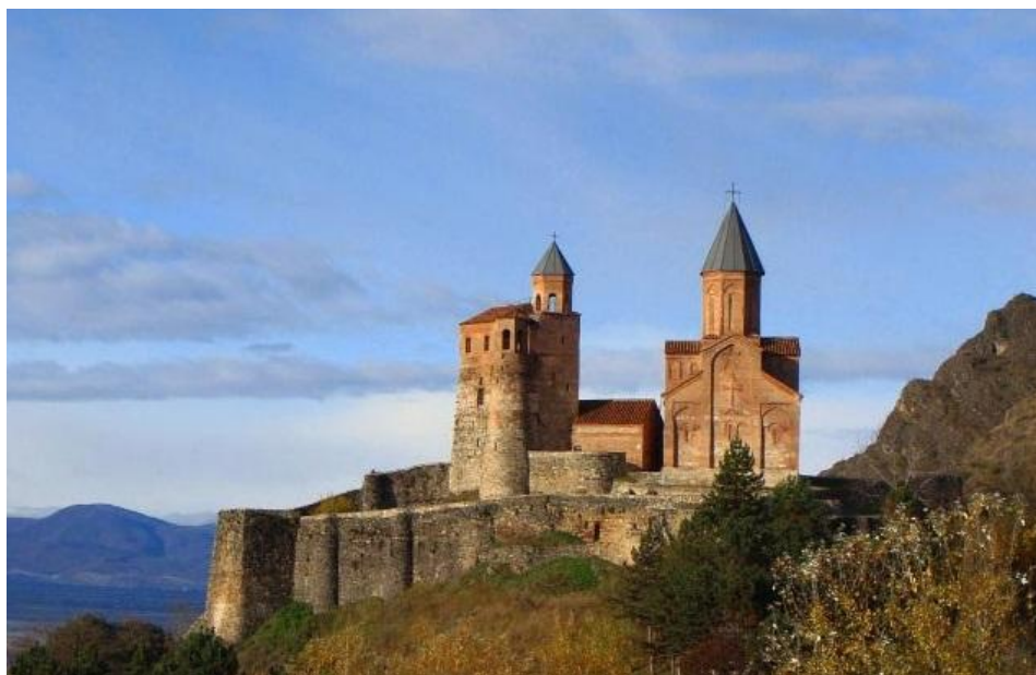
Рис. 1. Крепость Греми. Общий вид

В XV веке Кахетинское царство укрепилось, реже стали нашествия. В этой части Грузии были свои цари. Все это вызвало необходимость существования стольного города. Таким городом стал Греми. О Греми сохранилось мало исторических данных. Согласно одного из них, в XVII веке сын Александра II Константин, принявший ислам, убил своего брата и епископа Рустави. Восставшие против него кахетинцы отпраздновали победу в Греми.