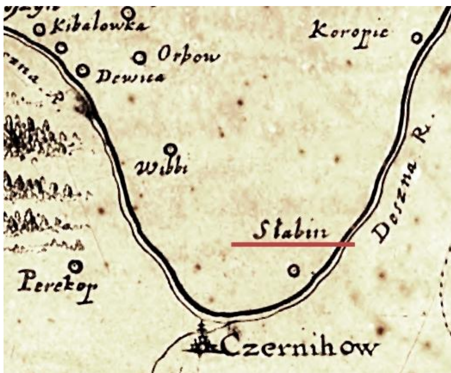
Рис. 1. Фрагмент Генеральной карты Украины Боплана с обозначением Слабина, 1646 (1648) гг.