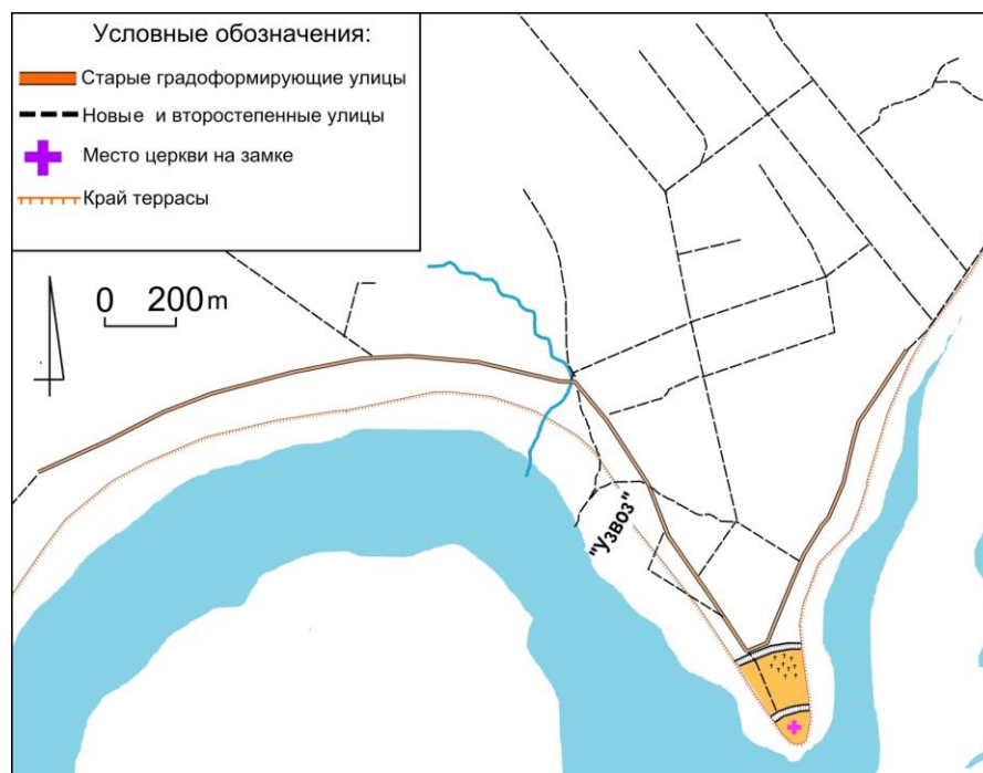
Рис. 4. Уличная схема Слабина, конец XX в.

Вероятно, первоначальное сельбище начала XVII в. располагалось на мысе где находились древнерусские укрепления. Впоследствии в 1630-х годах на краю мыса возник замок. Без проведения масштабных археологических исследований невозможно сказать, отрезан рвом «замок» от остальной части укреплений в начале XVII в. или же еще в древнерусские времена. Однако в данном случае это не так важно – важен, факт возникновения замка в первой половине XVII в. Именно он стал градообразующим ядром селения в XVII в. Если внимательно посмотреть на карту XIX в., то на месте перед первым рвом можно увидеть самую большую концентрацию переулков между двумя улицами, ведущими к замку с западной и восточной сторон мыса террасы. Эти второстепенные улицы и переулки сохраняют свою структуру и сегодня. Все они сходятся в одной точке, через которую идет дорога на территорию укреплений. Следует допустить, что именно здесь находились ворота ведущие в крепость. Также именно сюда выводит дорога с поймы на террасу, она проходит через спуск, имеющий достаточно старое происхождения. Древний узвоз мог быть только с этой стороны и проходить через современный спуск в силу рельефа местности, поскольку в других местах терраса имеет довольно крутые склоны, особенно с восточной стороны. Въезд на террасу с восточной стороны находился почти в 1 км севернее «замка».