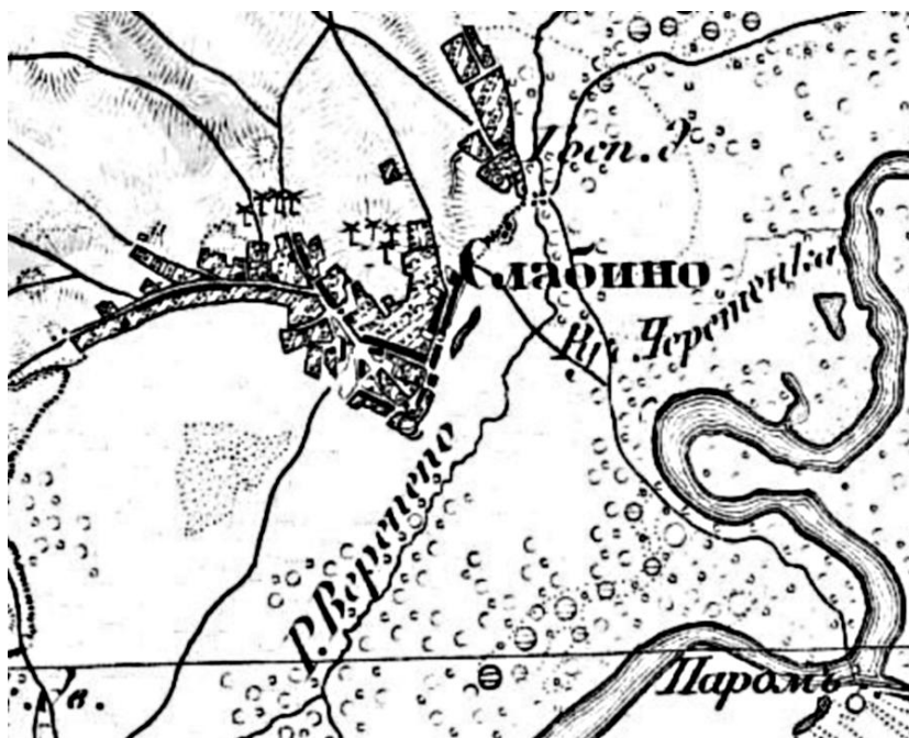
Рис. 3. Слабин на трёхверстовой карте Шуберта, вторая половина XIX в.

В середине XVII в. Слабин стал сотенным местечком Черниговского полка, его укрепления усиливаются. Так, в 1666 г. под Слабинской крепостью находились татарские войска, которые собирались идти вглубь Гетманщины, а также на Московию. Данные о том, взяли татары Слабин в 1666 г. или нет, отсутствуют. Также в том же 1666 г., Слабин упоминается как «город». Уже со второй половины XVII в. укрепления Слабина, как и большинства небольших сотенных городков Черниговского полка, постепенно пришли в упадок и уже к началу XVIII в. прекратили свое существование, поскольку в дальнейшем упоминания о них отсутствуют. Во второй половине XVIII в. на их месте зафиксированы лишь разрушенные остатки валов и ровов [1, с. 119-120]. Со второй половины XVIII в. и во времена А. Шафонского, то есть в последней четверти XVIII в. Слабин числился как село, а не как город или городок [11, с. 219].