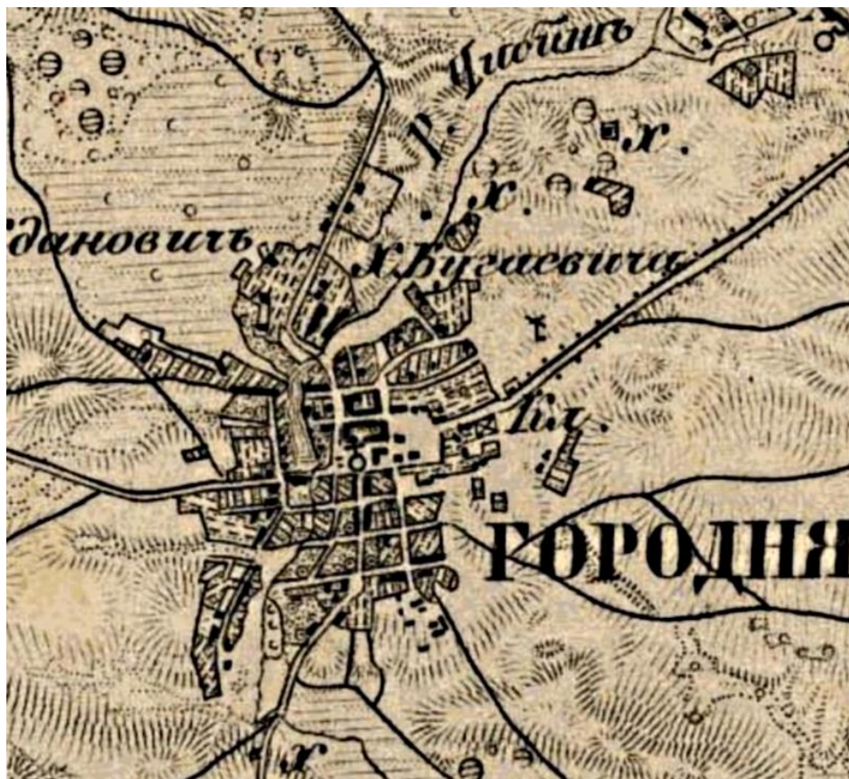
Рис. 3. Городня на 3-верстовой карте Шуберта, вторая половина XIX в.

Соборная деревянная Троицкая церковь, находилась на центральной площади. Она была построена в 1732 г., а перестроена в 1752 г. До сооружения этой Церкви, на ее месте стояла более ранняя, А. Шафонский указывал, что время ее сооружения не известно [9, с. 343]. Однако в издании 1882 г. указывается, что первоначальная деревянная церковь сгорела в 1696 г. [7, с. 5].