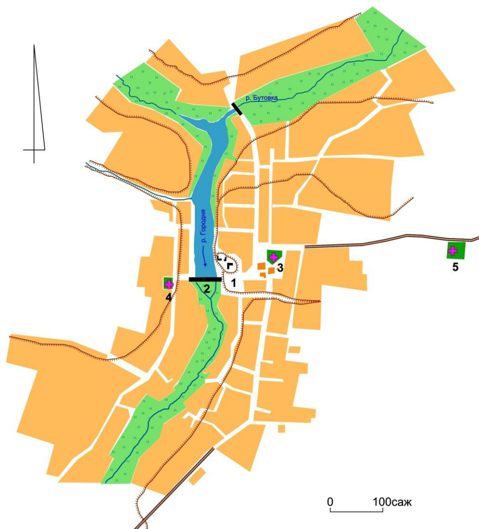
Рис. 2. План Городни начала XIX в. (прорисовка автора):

боярские из Городни, однако точных данных о какой именно Городне идет речь, не существует [2, с. 260]. По-этому, вернее всего будет считать точкой отсчета истории современной Городни первую половину XVII в. В начале 1640-х годов. Семья Фощей осадила «слободку Городню» [4, с. 291]. В 1649 г. Городня уже числилась населенным пунктом в составе Седневской сотни Черниговского полка, а с 1705 г. – сотенным городком. А. Шафонский в последней четверти XVIII в. зафиксировал: «О начале города, кем и на какой случай он построен, нет никакого известия. Но по утверждению городничьих жителей, на словесных преданиях своих предков основаному, известно, что Городня за польского владения не была городом королевским, но местечком, польскому шляхтичу Хвоцу принадлежащем... За самим городом, над рекою Чибрижем, и поныне то место изветсно, где дом, винокурня и колодезь Хвоца стояли, котораго следы еще видны. ... Во время изгнания Поляков из Малої Росси, розорена и опустошена была» [9, с. 340]. Далее А. Шафонский описывал, как черниговский полковник Д. Многогришний приказал переселить в Городню людей из Седнева, в результате чего Городня стала местечком. Такой шаг гетьмана, вероятно, был продиктован запустением населенного пункта после боевых действий конца 1640-х – начала 1660-х годов. По Румянцевской описи 1765 г. в Городне насчитывалось 167 дворов [5, с. 74].