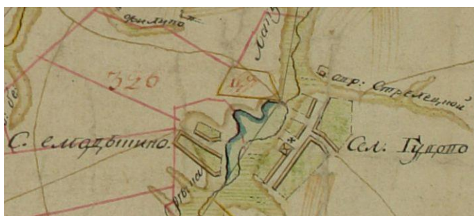
Рис. 2. Село Емадыкино на карте конца XVIII века

На «Геометрическом генеральном плане города Путивля и его уезда, состоящего в Курском наместничестве, сочинён в курской межевой конторе в 1785 году» село Емадыкино изображено на левом берегу р. Лопуга, напротив села Гудово. Между селами была построена дамба, по которой можно было свободно проехать через реку. В это время меняется и дорога Путивль – Севск. В XVIII веке она обходила место слияния Лопуги с безымянным ручьем и выходила напрямую на дамбу. Появление дамбы стало одной из причин перемещения села. К тому же в селе Гудово находилась церковь, куда ходили и жители Емадыкино (Рисунок 2).